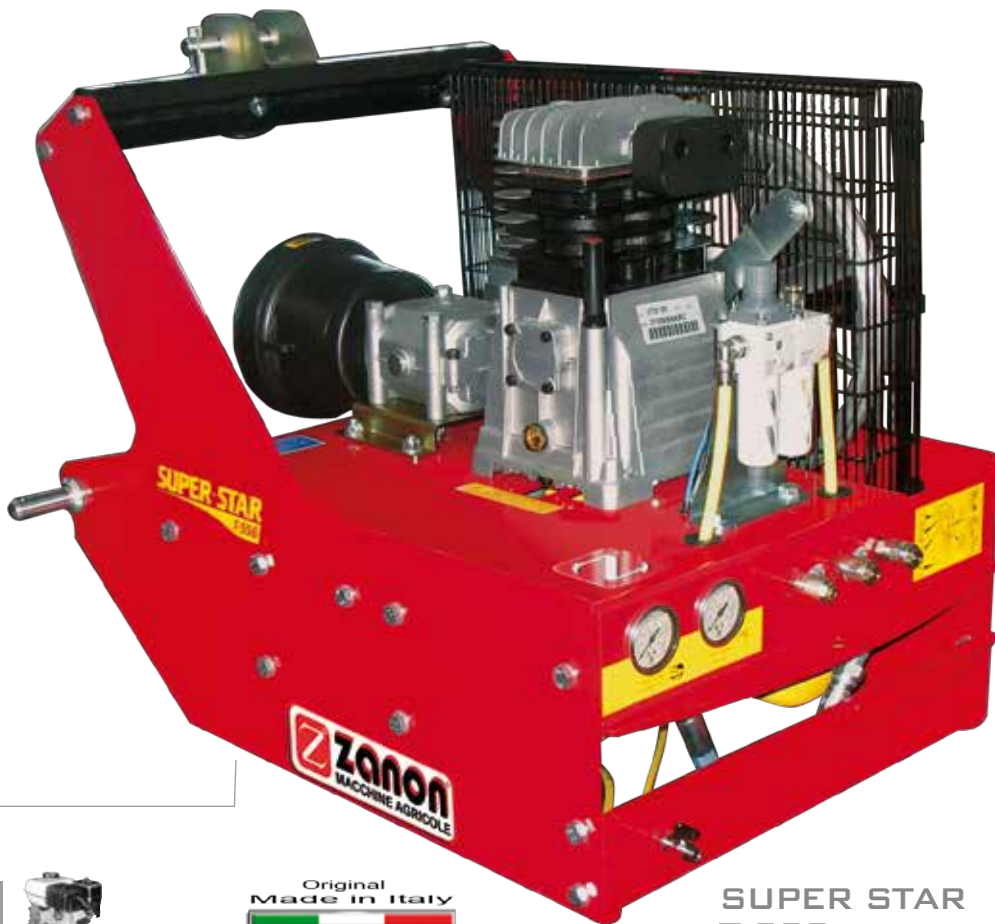
SUPER STAR T 558